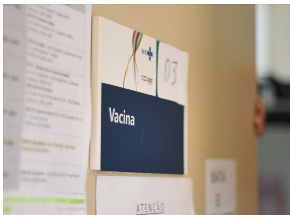
Reação adversa severa da vacina ocorre em apenas 0,0002% das aplicações, segundo Fiocruz