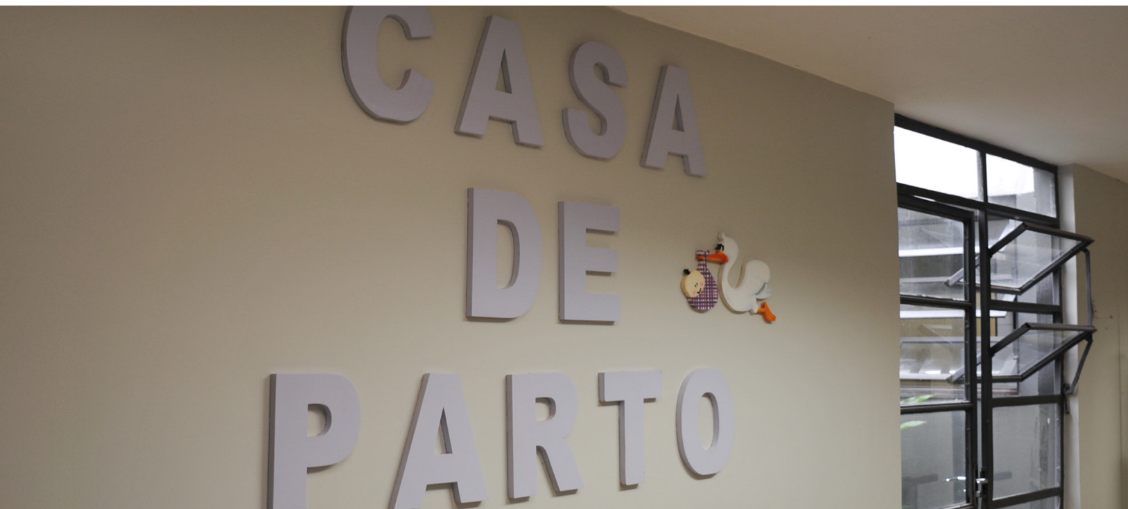
A Casa de Parto de São Sebastião só tem enfermeiras obstetras e realiza mais de 30 partos normais a cada mês.

O que você imagina ao pensar em um parto? Ao imaginar a cena, pode-se visualizar imagens que vão de uma parteira com água quente na panela a um centro cirúrgico ou a uma banheira na sala de casa. Em um ano, mais de 40 mil novas vidas nascem no Distrito Federal, e um levantamento inédito feito pelo Campus mostra que a maior parte desses nascimentos acontece por parto cirúrgico. Transformados em índices, os números do Datasus, o banco de dados do Ministério da Saúde, mostram que 55% de todos os partos realizados no DF em 2016 – o último ano já disponível – foram cesáreas. O percentual máximo recomendado pela Organização Mundial da Saúde (OMS) é de até 15%.