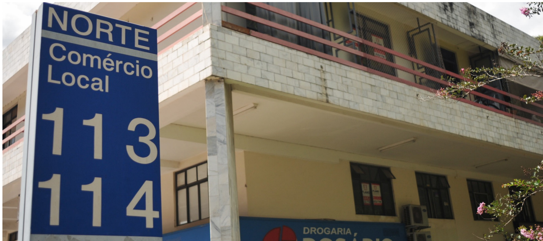
Na quadra comercial da 113 Norte, há duas dezenas de lojas desocupadas

Lojas vazias, placas de “aluga-se” e baixo movimento já são características comuns em áreas comerciais do Distrito Federal. Na quadra comercial da 113 Norte, por exemplo, há duas dezenas de lojas fechadas. No Vitrinni Shopping, de Águas Claras, 56 das 165 lojas estão desocupadas.