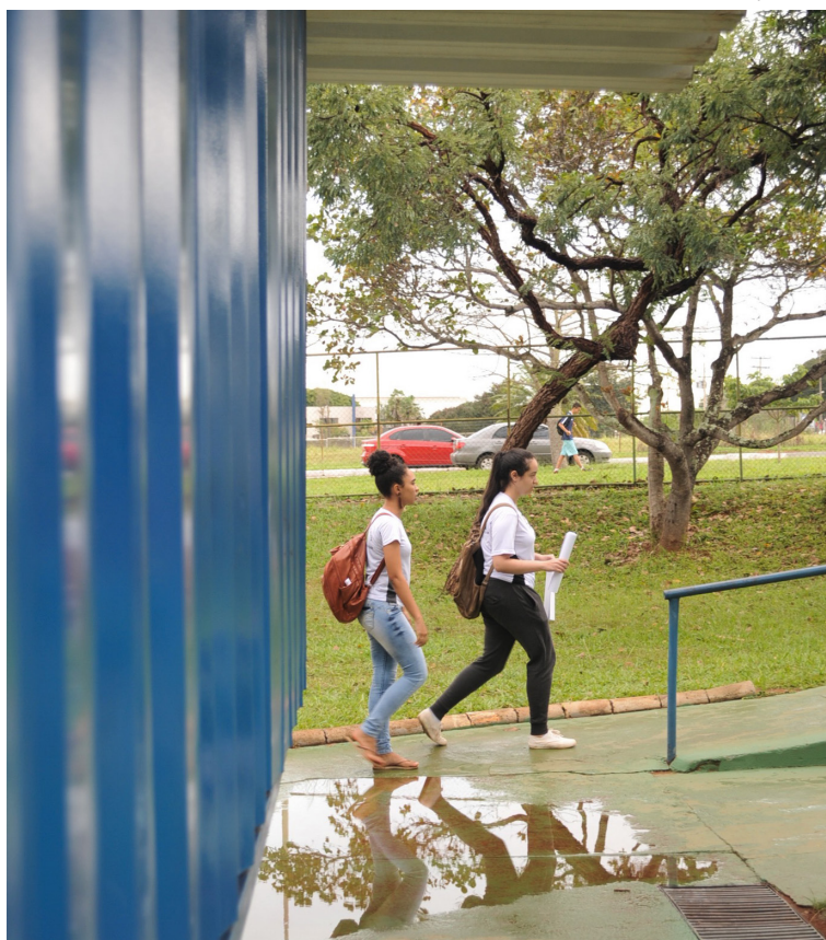
Alunos poderão ter conteúdos que envolvem a história dos símbolos nacionais