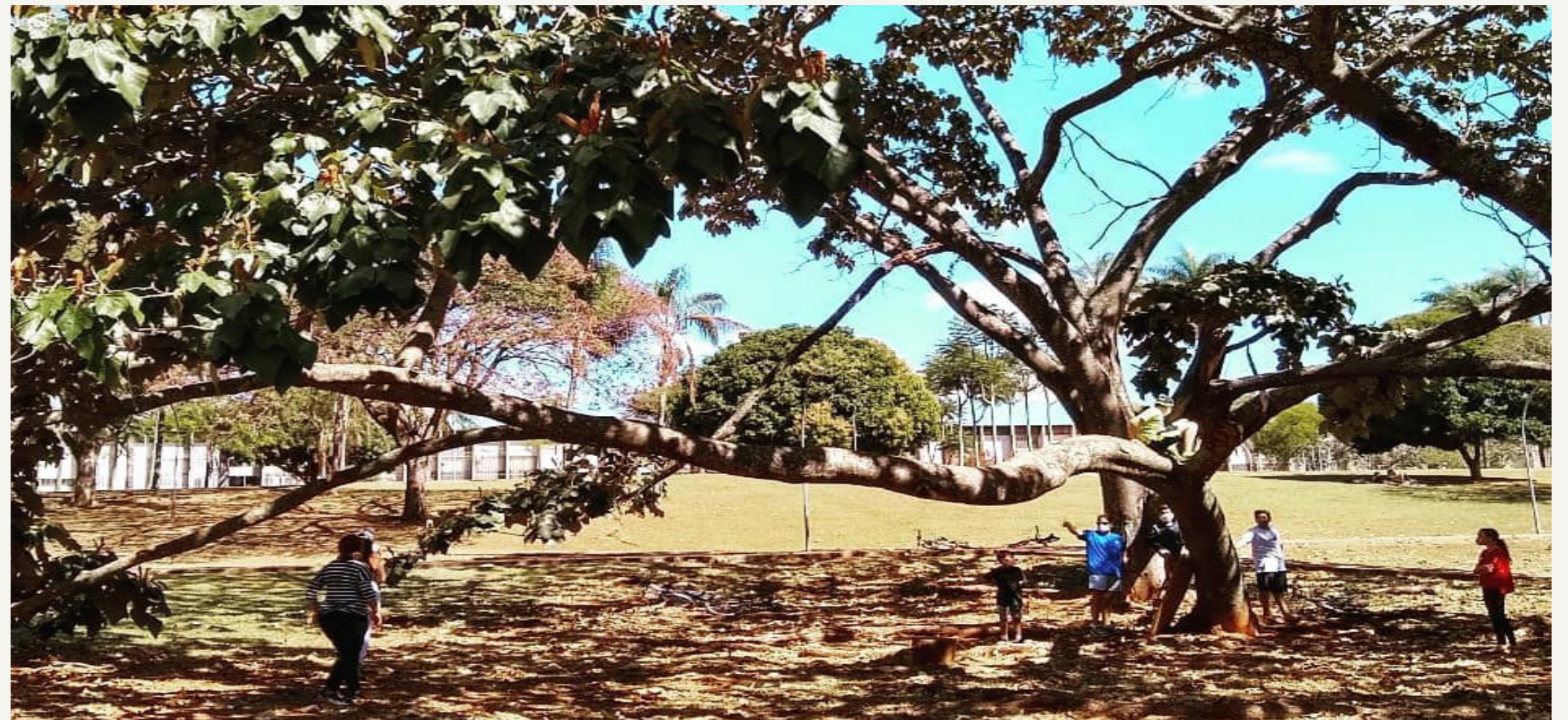
Para disfarçar as altas temperaturas, visitantes protegem-se do sol sob as árvores.

“Estudei aqui, então sabia da existência dos jardins, mas não imaginei que estivesse tendo esse