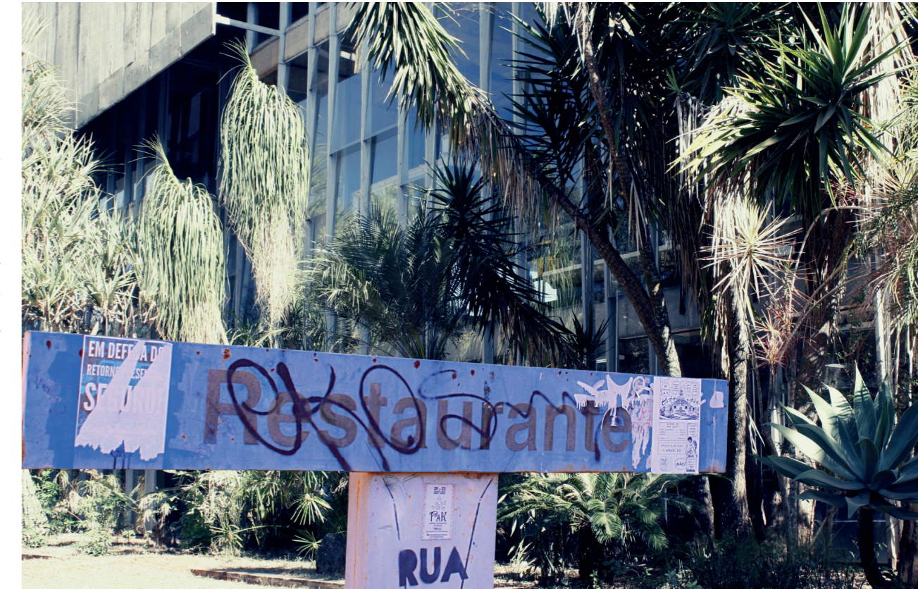
RU estuda se há oferta para demanda nos campi. Defensores da agricultura familiar afirmam que sim

30% do valor deste contrato – fechado em R$ 28.529.987 – fosse destinado à compra de alimentos da agricultura familiar, R$ 9.509.995 movimentariam esse setor. Mas, no edital de licitação ou no contrato não foram encontrados conteúdos relativos à aquisição de insumos desses produtores.