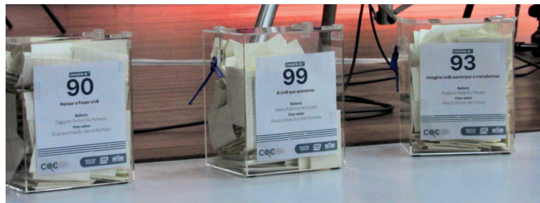
As três chapas receberam dezenas de perguntas anônimas em suas respectivas urnas.

Rozana também teve que se defender de insinuações sérias no debate da FGA. “Já que foi decana de Administração na gestão, como avalia as irregularidades apontadas pelo TCU no contrato de manutenção de eleva-