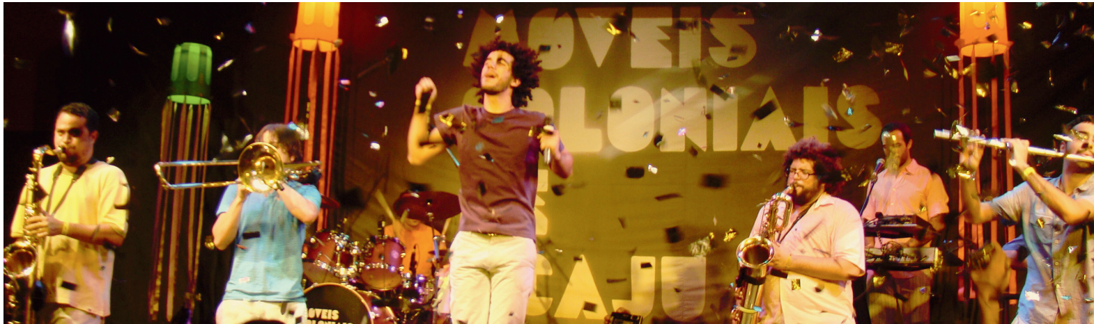
A Móveis Coloniais de Acaju ganhou o Finca em 2002 e se separou em 2016.

Por Beatrice Mesiano e Maria Eduarda Lavocat