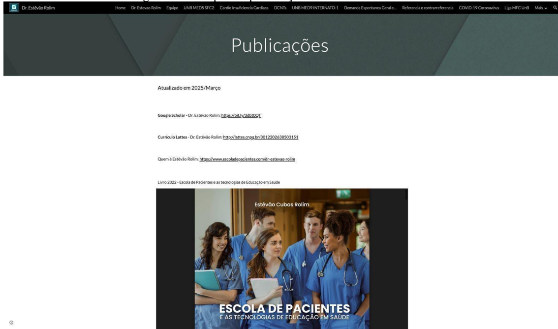
Figura 2. Exemplo de publicações da Escola de Pacientes