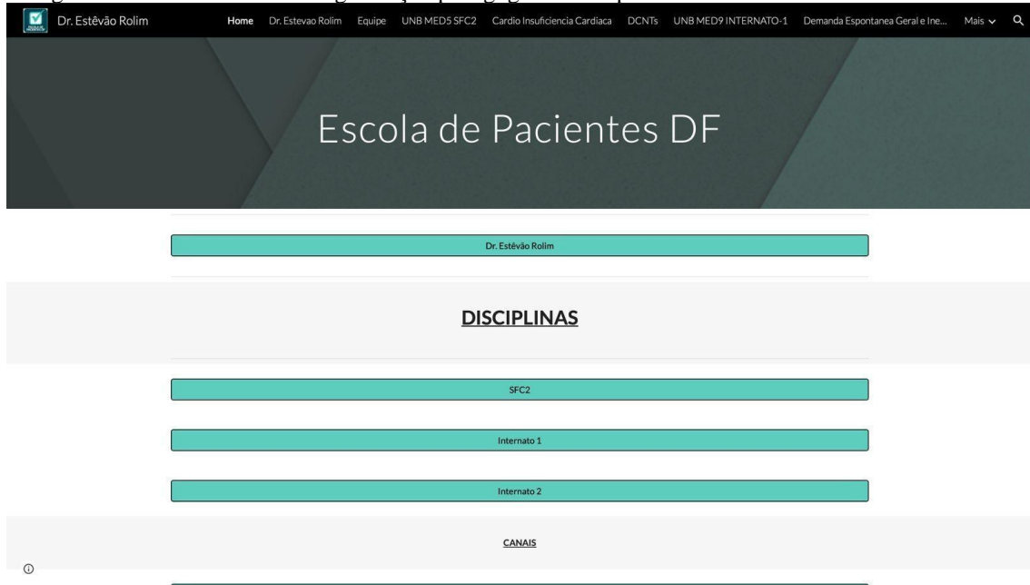
Figura 3. Estrutura inicial de organização pedagógica e disciplinar do site da Escola de Pacientes DF.