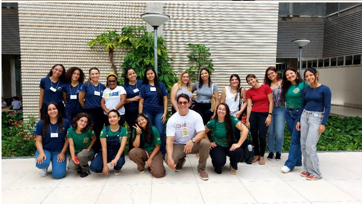
05/11/2025- EV1105-2025, Estatística em Territórios em Movimento: Inovação e Sociedade a partir da UnB