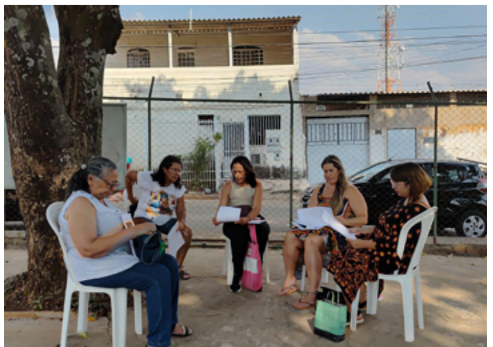
Participantes divididos em Grupos de Trabalho (GTs) durante a leitura e discussão do capítulo de Pedagogia da Autonomia.

“O primeiro encontro do Cartas do Nosso Chão foi de uma beleza que emocionou. Foi como se, juntos, pudéssemos enxergar novas cores na aridez que, por vezes, marca nosso cotidiano pessoal e profissional. As conversas foram permeadas por inquietações, convergências, contradições, aproximações, afastamentos e espantos. Cada experiência compartilhada foi um momento de puro acolhimento, amorosidade e problematização”.