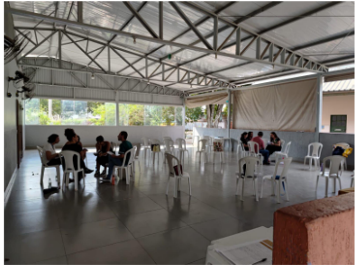
Participantes divididos em Grupos de Trabalho (GTs) durante a leitura e discussão do capítulo de Pedagogia da Autonomia.

Em seguida, dividimos os participantes em três Grupos de Trabalho (GTs). Cada grupo ficou responsável por uma parte do primeiro capítulo de “Pedagogia da Autonomia”, realizando a leitura compartilhada. Nos GTs, cada pessoa leu um pedaço do texto destinado ao seu grupo, e em seguida discutimos o que foi lido e como aquelas reflexões se aplicavam em nossas vidas. Esse processo gerou um momento de forte emoção, marcado por partilhas, trocas intensas e pelo diálogo freiriano que dá sentido à construção coletiva do conhecimento.