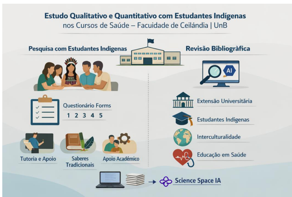
Figura 1. Ilustração do processo metodológico