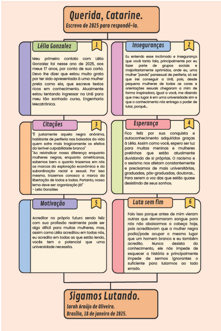
Figura 2 – Mapa Mental com a Carta do Grupo 2 de autoria de Sarah Araujo de Oliveira (estudante do Ensino Médio). Resposta para a Carta do Grupo 1 de autoria de Catarine (Estudante da UnB) (Figura 1)