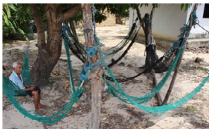
Espaço de descanso e conversas em Mamuna