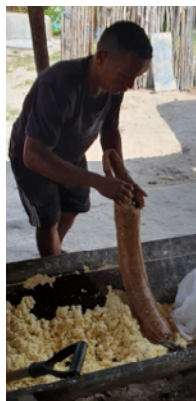
Colocando a massa da mandioca ralada no tipiti 2 para ser prensada