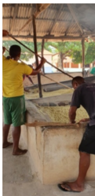
Torrando a massa, última etapa da produção da farinha