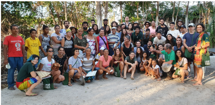
Moradores de Mamuna e os participantes da Vivência Amazônica