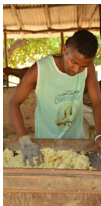
Peneirando a massa da mandioca prensada para ser torrada