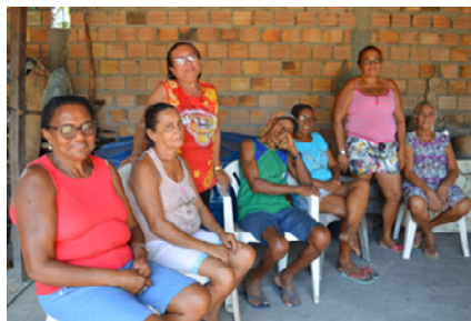
Moradoras/es de Canelatiua