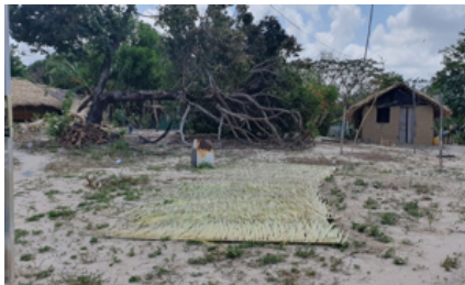
Secagem da palha de palmeiras utilizadas para a cobertura de casas e cestos em Mamuna