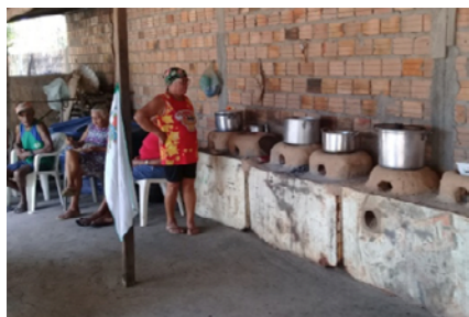
Cozinha de Canelatiua utilizada para festas