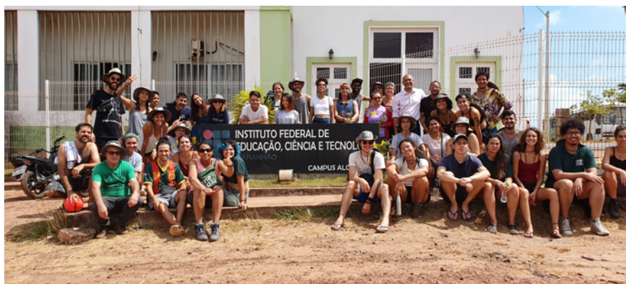
Instituto Federal de Educação, Ciência e Tecnologia - Campus de Alcântara