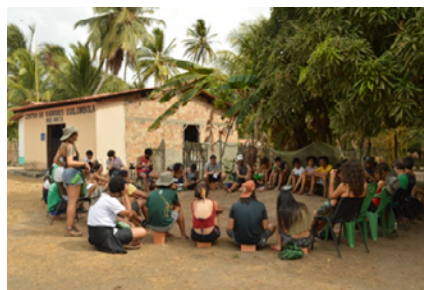
Roda de conversa realizada na comunidade quilombola Canelatiua, município de Alcântara-MA

As comunidades quilombolas Mamuna e Canelatiua têm um forte vínculo com seus territórios de trabalho e vida e, por estarem localizadas no litoral, também têm relação estreita com o mar. Realizam atividades como a pesca, a agricultura, o extrativismo, a coleta e também confeccionam artesanatos. Apesar de terem seus modos de vida historicamente e institucionalmente invis-