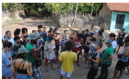
Comunidade quilombola Canelatiua