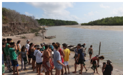
Comunidade quilombola Canelatiua

Construído e organizado por moradores e moradoras da comunidade quilombola de Canelatiua, em Alcântara, Maranhão, o Centro de Saberes Quilombola Mãe Anica, se constitui num espaço de auto-representação da comunidade, onde então expostos elementos representativos de seus saberes e práticas. Um dos objetivos é resgatar a memória da comunidade e contribuir na formação de crianças e jovens. Também é uma das formas que encontraram de contestar o "Museu da Base", que não leva em consideração a existência ancestral das comunidades quilombolas em Alcântara