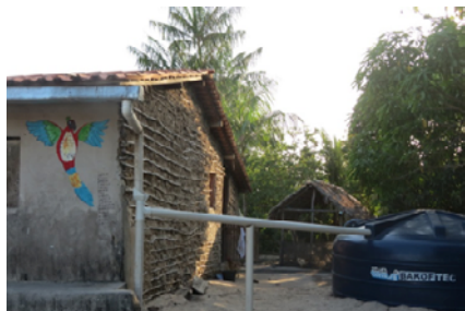
Casa com aproveitamento de água da chuva na comunidade Mamuna