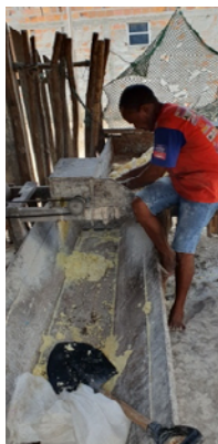
Ralando a mandioca