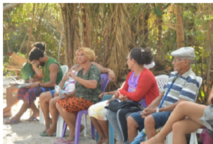
Roda de conversa na comunidade quilombola de Mamuna