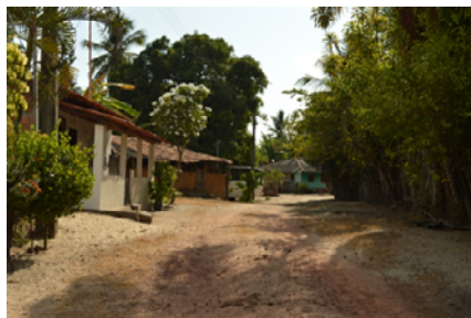
Casas da comunidade Canelatiua