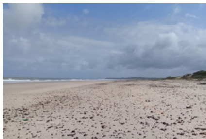
Praia da comunidade Canelatiua