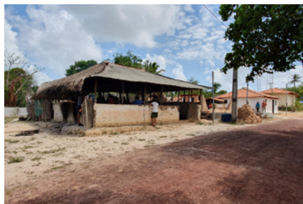
Casa de farinha da comunidade Mamuna