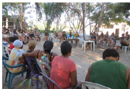
Roda de conversa realizada na comunidade quilombola Mamuna, município de Alcântara, estado do Maranhão