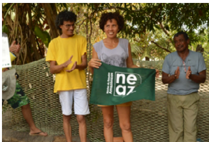
Lideranças de Canelatiua recebendo o NEAz