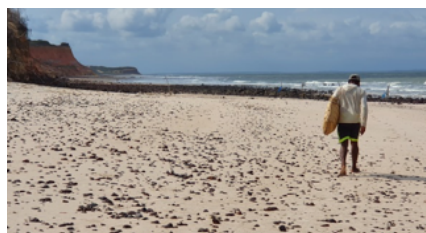
Morador de Canelatiua indo para o território de pesca