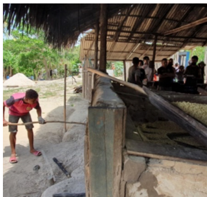
Colocando lenha no forno, onde a massa de mandioca peneirada está sendo torrada para a farinha