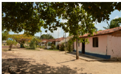
Casas da comunidade Mamuna

Aqui nós lutamos por uma justa causa, que são as nossas raízes, a nossa identidade, a nossa vida. (...) Sair daqui é perder uma