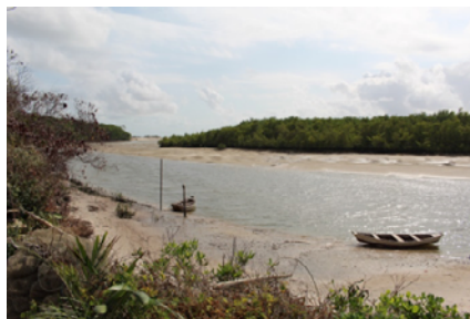
Curso de água utilizado pela comunidade Canelatiua