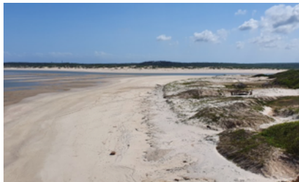
Praia da comunidade Mamuna