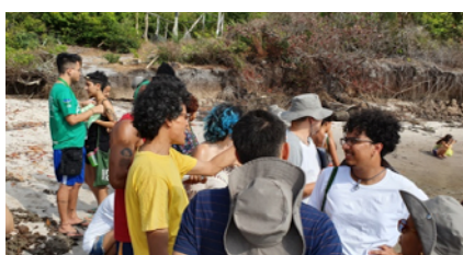
Conhecendo os espaços utilizados pela comunidade quilombola Canelatiua