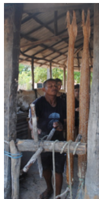
Prensando a massa da mandioca ralada