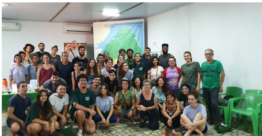
Sindicato dos Trabalhadores e Trabalhadoras Rurais de Alcântara