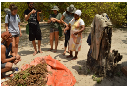
Frutos de Mamona secando ao sol em Mamuna