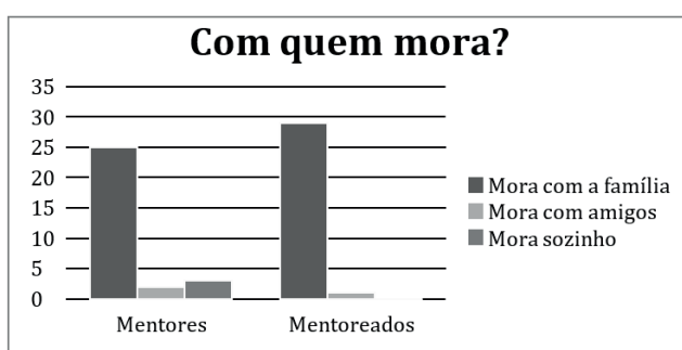
Figura 4. Frequência de estudantes mentores e mentoreados por moradia do Projeto de MentoriaEstudantil do Departamento de Enfermagem, UnB (Brasília – DF), 2017.

Tal perfil assemelha-se ao de outros estudos e reitera uma vez mais o arquétipo da profissão de enfermagem marcada ao longo da história e até os dias de hoje por divisões sexistas, uma vez que o ato de cuidar ainda é designado culturalmente ao feminino (XIMENES et al., 2017; GARCIA; MORAES; GUARIENTE, 2016).