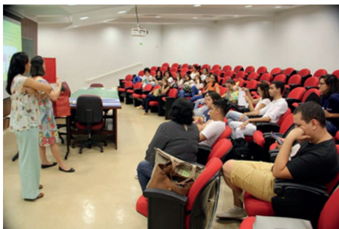
Figura 1. Encontro de Boas Vindas ao Projeto de Mentoria Estudantil do Departamento de Enfermagem, UnB (Brasília – DF), 2017.

Após o recrutamento de novos integrantes, ainda no mês de março, foi realizado o Encontro de Boas Vindas ao Projeto (Figura 1), momento em que os estudantes selecionados foram acolhidos e reunidos para uma apresentação detalhada das atividades a serem desenvolvidas no âmbito projeto e também para definição dos pares/duplas de mentor-mentoreado, a partir do perfil de cada estudante.