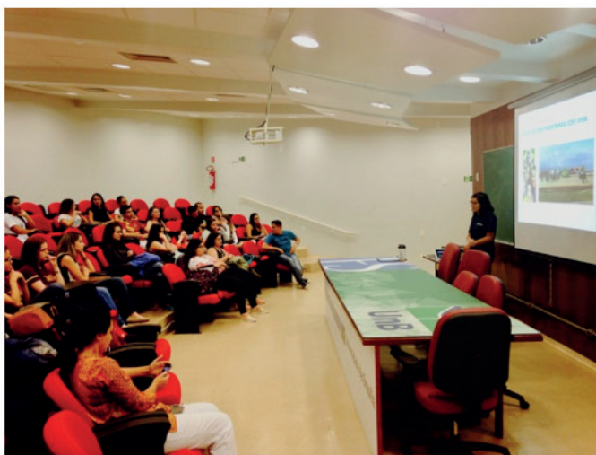
Figura 5. Bate-papo sobre oportunidades acadêmicas no curso de enfermagemdo Projeto de Mentoria Estudantil do Departamento de Enfermagem, UnB (Brasília – DF), 2017.

O Bate-papo foi organizado e conduzido por estudantes mentores que vivenciaram experiências de intercâmbio, iniciação científica e extensão. Os estudantes compartilharam suas vivências, informações e dicas de como participar dos programas disponibilizados pela universidade: Programa Institucional de Bolsas de Extensão (Pibex), Programa de Iniciação Científica (ProIC), Programa MARCA, Programa Ciências sem Fronteiras, além de projetos de extensão e linhas específicas de pesquisa na área de Enfermagem do Campus Darcy Ribeiro.