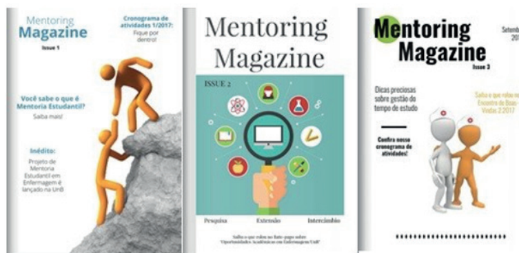
Figura 6. Volumes publicados da Mentoring Magazine do Projeto de Mentoria Estudantil do Departamento de Enfermagem, UnB (Brasília – DF), 2017.

Por fim, ainda como produção dessa breve, mas intensa experiência do primeiro semestre da Mentoria, elaborou-se a Mentoring Magazine, um boletim eletrônico informativo com a memória das atividades realizadas no projeto (Figura 6).