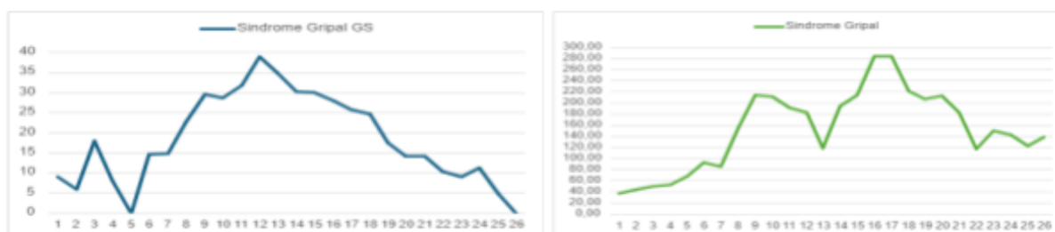
Figura 7. Incidência(1.000 mil usuários) da síndrome gripal do Guardiões da Saúde, do 1º semestre de 2024. E a incidência(100 mil habitantes) da síndrome gripal do Distrito Federal do 1º semestre de 2024, da semana epidemiológica 1 a 26.